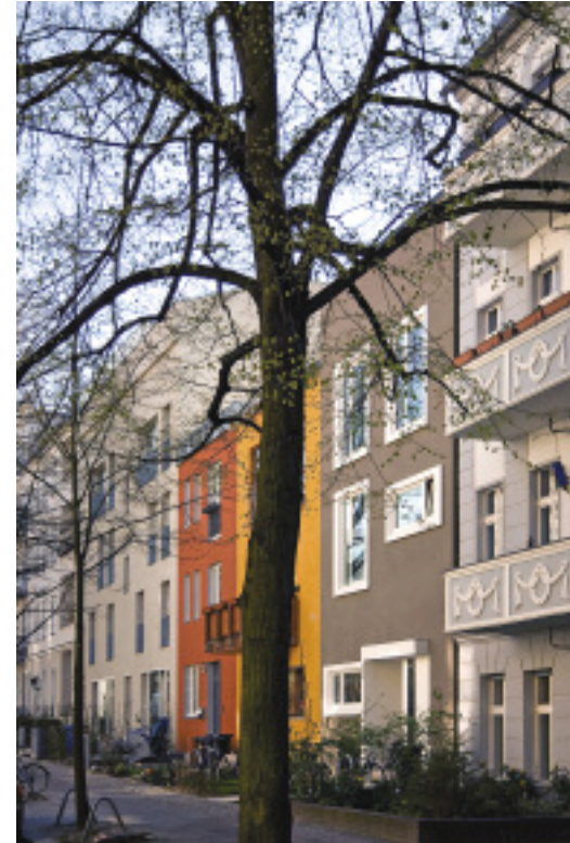
Geschickt passten die Architekten das Haus in die Baulücke ein und schufen so ein Domizil, das den Bewohnern auf fünf Ebenen viel Raum bietet.